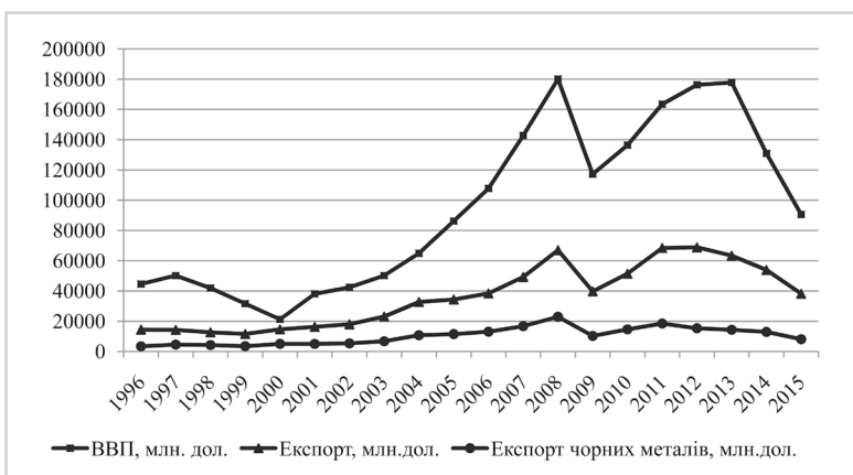
Рис. 2: ВВП, експорт та експорт чорних металів в Україні в 1996–2015 рр.

Дослідимо перспективи агропромислового комплексу України з точки зору його експортної спрямованості та окреслимо основні моделі соціально-економічного розвитку нашої держави з урахуванням виявлених тенденцій. Постійне збільшення чисельності населення земної кулі утримує світові ціни на сільськогосподарську продукцію на досить високому рівні, що позитивно впливає на український експорт. Підтримкою нарощування поставок зерна з України