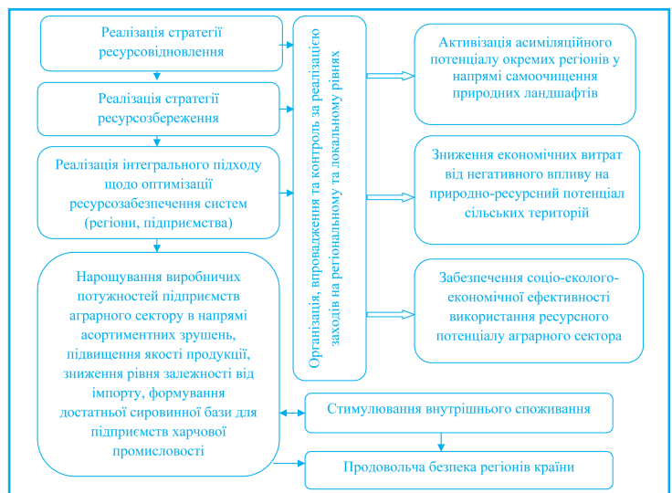
Рис. 1. Взаємозв'язок ресурсозабезпечення аграрного сектору та продовольчої безпеки

У країнах Європейського Союзу державна політика ресурсозбереження передбачає стимулювання реалізації ресурсозбережувальних проектів у сфері суспільного споживання як найбільш ефективний захід. Важливе значення при обґрунтуванні та впровадженні заходів щодо ресурсозбереження відводиться життєвому циклу суб'єкта, галузевим і територіальним особливостям. Залучення ін-