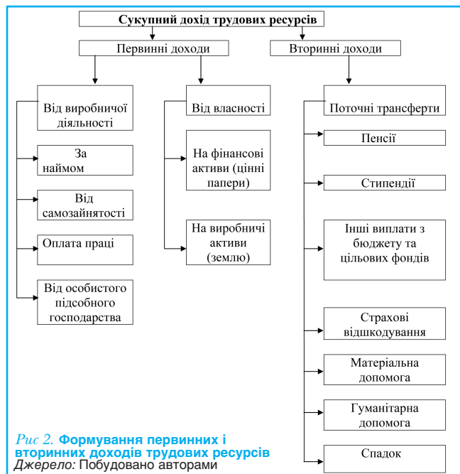
Рис 2. Формування первинних і вторинних доходів трудових ресурсів Джерело: Побудовано авторами

Як зазначалося вище, функціонування робочої сили в умовах ринкової економіки неможливе без використання коштів, рух яких здійснюється у формі грошових потоків.