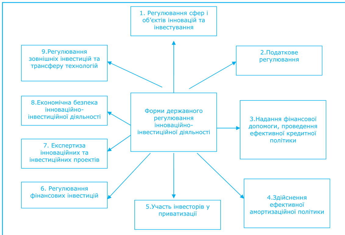
Рис 1. Основні форми державного регулювання інноваційно-інвестиційної діяльності