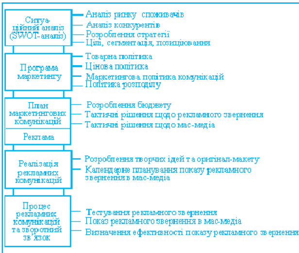
Рис 2. Процес планування ефективною рекламної комунікації

Певні особливості диктують умови щодо використання реклами в каналах розподілу. Модель ефективної рекламної комунікації наведено на рис. 2.