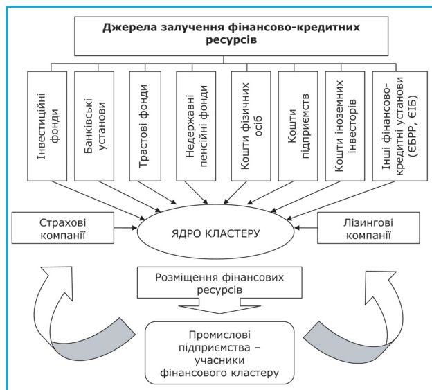
Рис. 3. Модель фінансового кластеру

На думку автора, способом вирішення вищеперерахованих проблем є створення на території західних областей фінансового кластеру, який за умови співробітництва різних фінансових установ і промислових підприємств сприятиме позитивному ефекту для всіх учасників. Отже, формування фінансового кластеру передбачатиме об'єднання не тільки різнотипових фінансових установ (банків, інвестиційних, трастових фондів тощо), а й підприємств, які матимуть змогу створювати і виробляти конкурентоспроможну, інноваційну продукцію. На підставі проведеного аналізу автором запропоновано власну модель фінансового кластеру, яка базується на засадах консолідації та інтеграції (рис. 3).