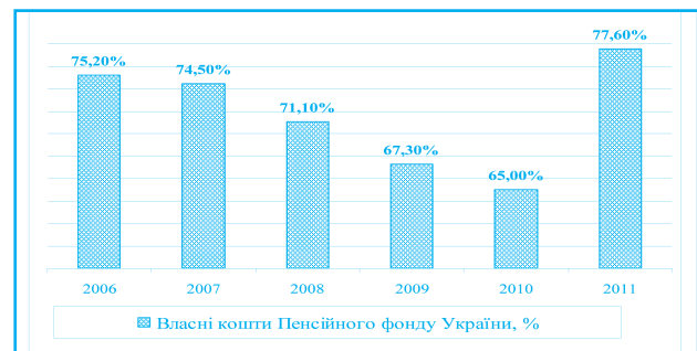
Рис. 2. Власні доходи Пенсійного фонду України у 2006-2011 рр., %

У структурі доходів бюджету Пенсійного фонду частка власних коштів упродовж 2006–2010 рр. зменшилася від 75,2% до 65,0%; і лише у 2011 р. вона зросла до 77,6%, що відображено на рис. 2.