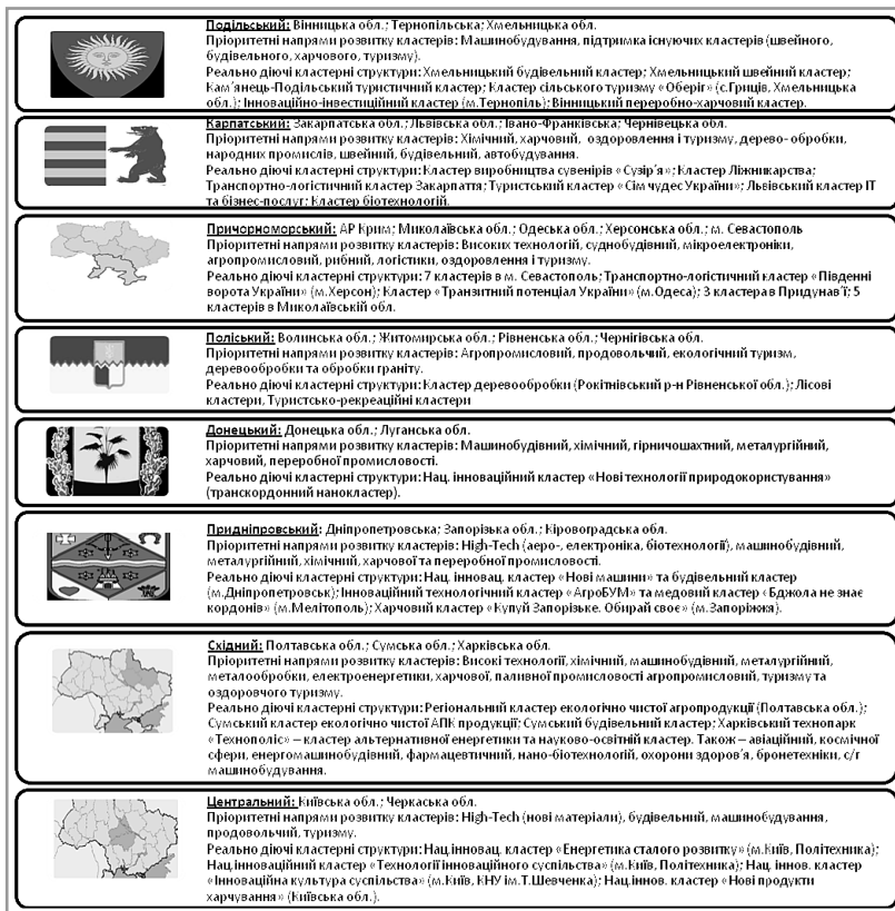
Рис. 3. Характеристика кластерних систем у регіонах України