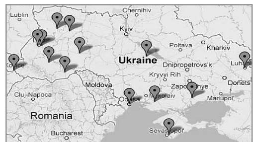
Рис. 2. Центри кластерів

У зв'язку з перевагами, пов'язаними з агломераційними тенденціями, кластери привер-