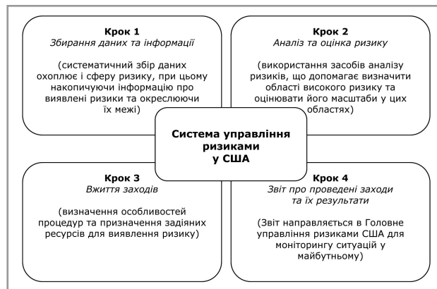
Рис. 2. Система управління ризиками у США

Митна служба Сполучених Штатів, як і багатьох інших