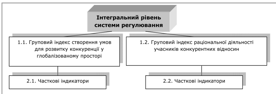
Рис. 1. Ієрархія індикаторів рівня системи регулювання конкурентних відносин у глобалізованому просторі