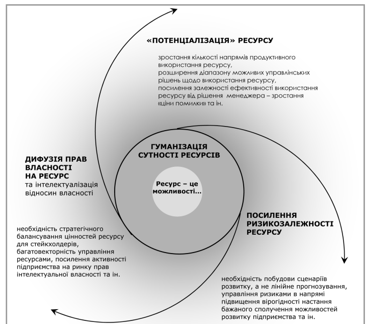
Рис. 4. Гуманізація сутності ресурсів в економічній теорії та супровідні тенденції Джерело: Власна розробка автора

Авторський підхід полягає в розумінні ресурсів підприємства як можливостей його розвитку, а відтак наші подальші дослідження будуть спрямовані на вирішення теоретико-методичних і прикладних проблем управління ресурсами в контексті стратегічного управління підприємством.