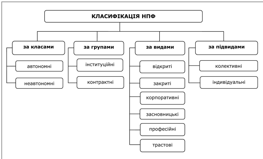
Рис. 2. Класифікація недержавних пенсійних фондів

Висновки та пропозиції. Враховуючи вищезазначене, стає очевидним, що подальше реформування пенсійної системи в Україні потребує, перш за все, вивчення закордонного досвіду і принципів побудови саме недержавного пенсійного забезпечення. Проведений аналіз закордонного досвіду побудови різних моделей НПФ дозволив нам розробити власну класифікацію цих фондів (рис. 2) та висловити пропозиції, що можуть бути корисними для подальшого розвитку недержавних пенсійних фондів в Україні: