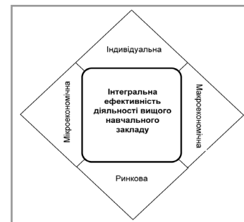
Рис. 2. Структура інтегральної ефективності діяльності вищого навчального закладу