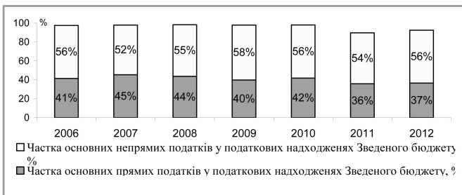
Рис. 1. Співвідношення прямих та непрямих податків у складі податкових надходжень Зведеного бюджету України, 2006–2012 рр.

Аналіз динаміки співвідношення питомої ваги прямих та непрямих податків у складі податкових надходжень Зведеного бюджету України показує, що в Україні протягом 2006–2012 рр. переважає частка непрямих податків – 52–56% загального обсягу податкових надходжень (рис. 1).