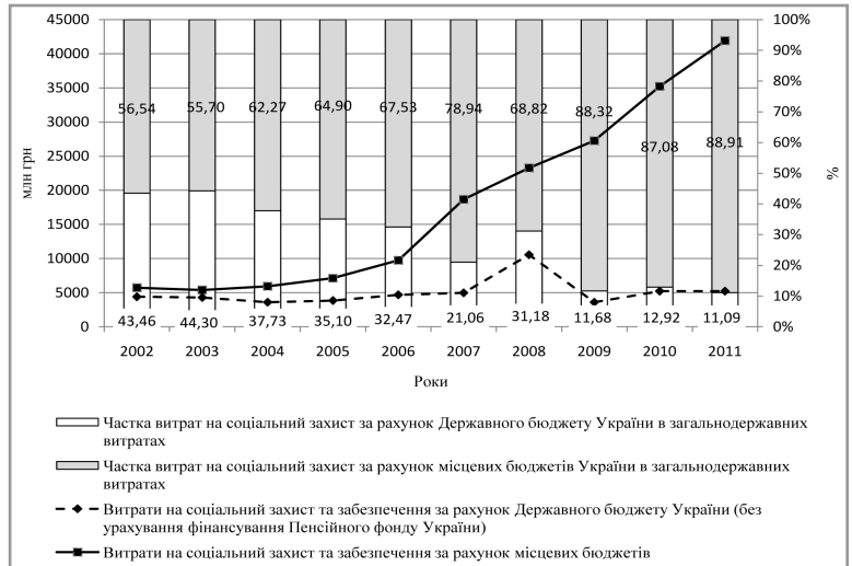
Рис. 2. Динаміка зміни абсолютного та відносного розміру витрат на соціальний захист і соціальне забезпечення за рівними бюджетної системи

З огляду на це на місцевому рівні негайного вирішення, на нашу думку, потребують такі питання: удосконалення міжбюджетних відносин у напрямі збільшення повноважень місцевих органів влади при розрахунку потреби у фінансових ресурсах для соціального захисту населення;