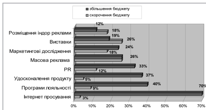
Рис. 3. Тенденції перерозподілу бюджету маркетингу вітчизняних підприємств