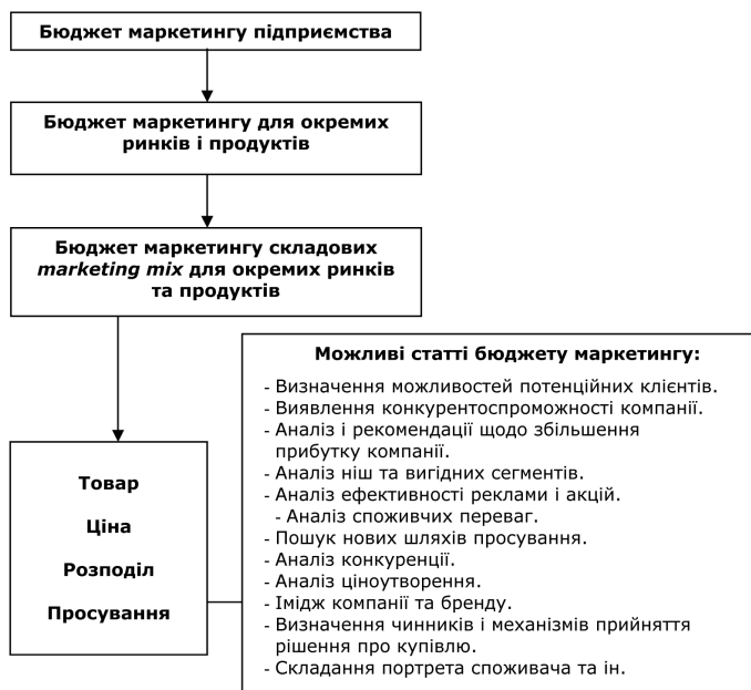
Рис. 2. Формування бюджету маркетингу для окремих складових marketing mix