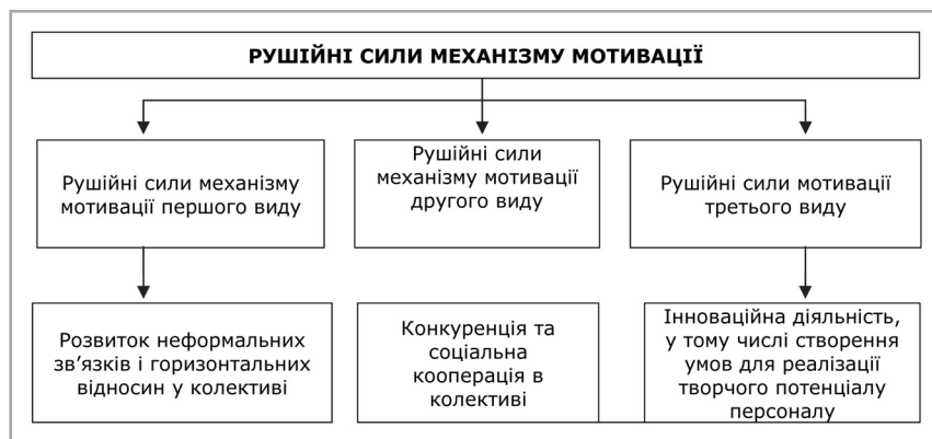
Рис. 2. Рушійні сили різних видів механізму мотивації праці

Висновки. Упровадження запропонованого нами мотиваційного механізму вирішуватиме такі завдання системи управління персоналом: забезпечення умов для реалізації загальних стратегій і цілей; реалізація та розвиток