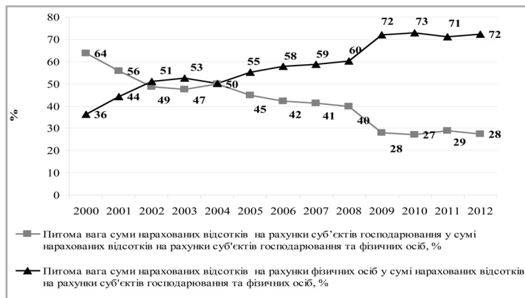
Рис. 1. Суми нарахованих відсотків за коштами, залученими банками на рахунки суб'єктів господарювання та фізичних осіб

По-друге, маловірогідно, що оподаткування відсотків призведе до відтоку коштів із депозитних рахунків, адже для цього потрібно мати альтернативні варіанти вкладання грошей. В Україні такі варіанти фактично відсутні. Наприклад, придбання цінних паперів має податкові наслідки, оскільки проценти та дивіденди оподатковуються. Крім того, цей напрям інвестування коштів є більш ризикованим, ніж їх розміщення на депозитних рахунках.