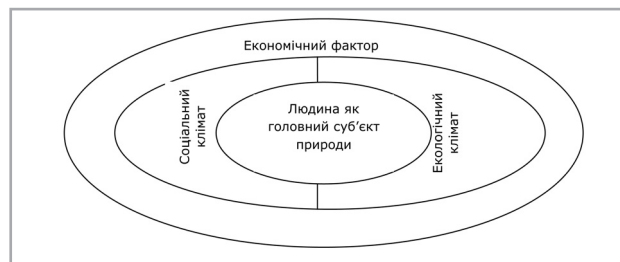
Рис. 1. Взаємодія основних факторів розвитку соціально-економічних систем, орієнтованих на людину

У цьому контексті доцільно розглядати розвиток як загальний процес в органічній єдності екологічного, соціального, людського та економічного розвитку. Зазначений