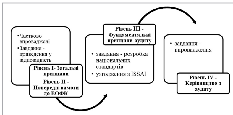
Рис. 3. Послідовність упровадження стандартів ISSAI

«Фундаментальні принципи аудиту»; 3 етап – упровадження стандартів ISSAI рівня 4 «Керівництво аудитом». Запропоновані підходи, на відміну від існуючих, визначають вектор стандартизації діяльності Рахункової палати України і варіанти декларації про ступінь прихильності ISSAI.