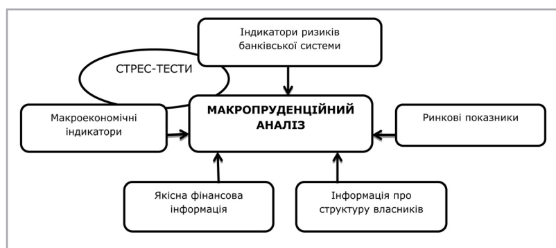
Рис. 2. Компоненти макропруденційного нагляду

темних ризиків через певні індикатори фінансового сектору і макроекономічні показники у країні, що продемонстровано на рис. 2.