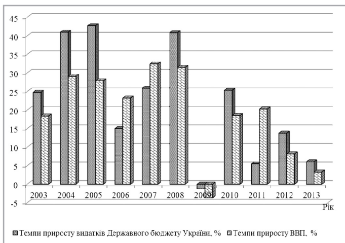
Рис. 1. Динаміка темпів приросту витратів Державного бюджету України та ВВП у 2003-2013 рр. Джерело: [8]

Порівняння динаміки витратів Державного бюджету України та ВВП засвідчує відсутність чіткої залежності між темпами економічного зростання у країні й темпами нарощення обсягів державного фінансування (рис. 1).