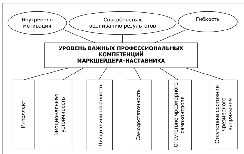
Рис. 2. Модель профессиональных компетенций наставника-маркшейдера

модели наставничества. Ее целесообразно реализовывать в русле компетентностного подхода, что позволит повысить успешность адаптации новичков, снизить текучесть кадров, поднять показатели производительности труда, а также улучшить маркшейдерское обеспечение горных работ. На основе эмпирически подтвержденной модели предлагается отбирать наставников по двум группам критериев: ПВК (высшее профессиональное образование, стаж работы в должности от 5 лет, грейд/разряд потенциальных наставников не ниже среднего по предприятию) и личностные компетенции (интеллект, дисциплинированность, самодостаточность, эмоциональная устойчивость, отсутствие чрезмерного самоконтроля и напряжения, внутренняя мотивация, способность к оценке результатов, гибкость в принятии решений). Наше исследование позволяет сделать вывод, что компетенцию «наставничество» следует рассматривать как условие обеспечения оперативной адаптации маркшейдеров-новичков к работе.