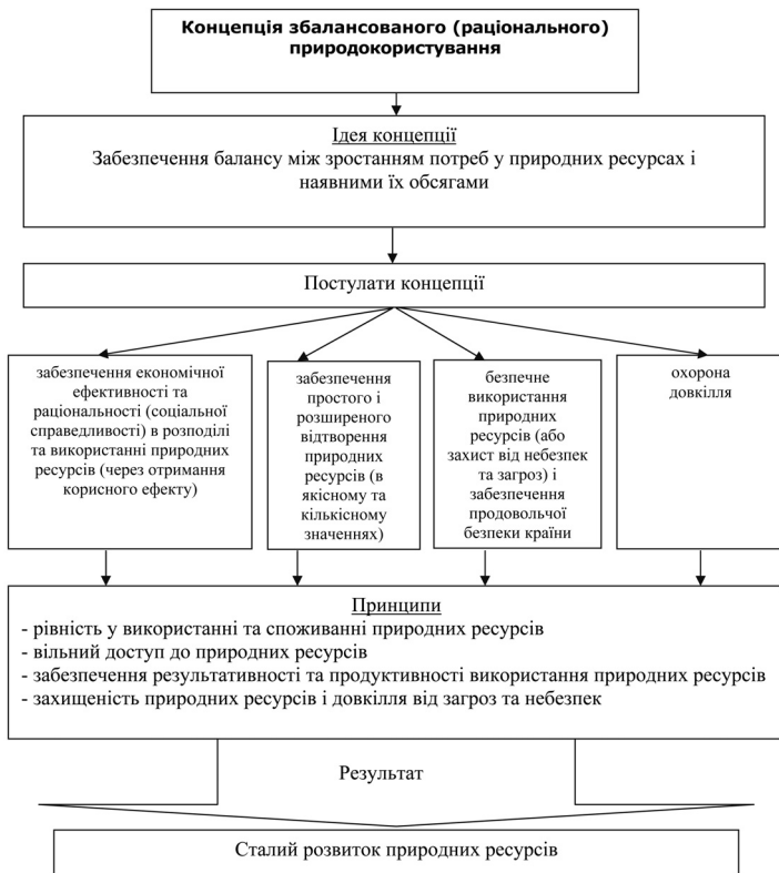
Рис. 2. Концепція збалансованого (раціонального) природокористування

Отже, розглянувши теорії природокористування і генезу їх становлення, можна зробити висновок про вагомий внесок економістів різних країн та течій у процес управління відновлювальними природними ресурсами. Досліджені вище концепції природокористування дозволяють визначити базові засади переходу на модель збалансованого природокористування, розробити виважений механізм управління відновлювальними природними ресурсами.