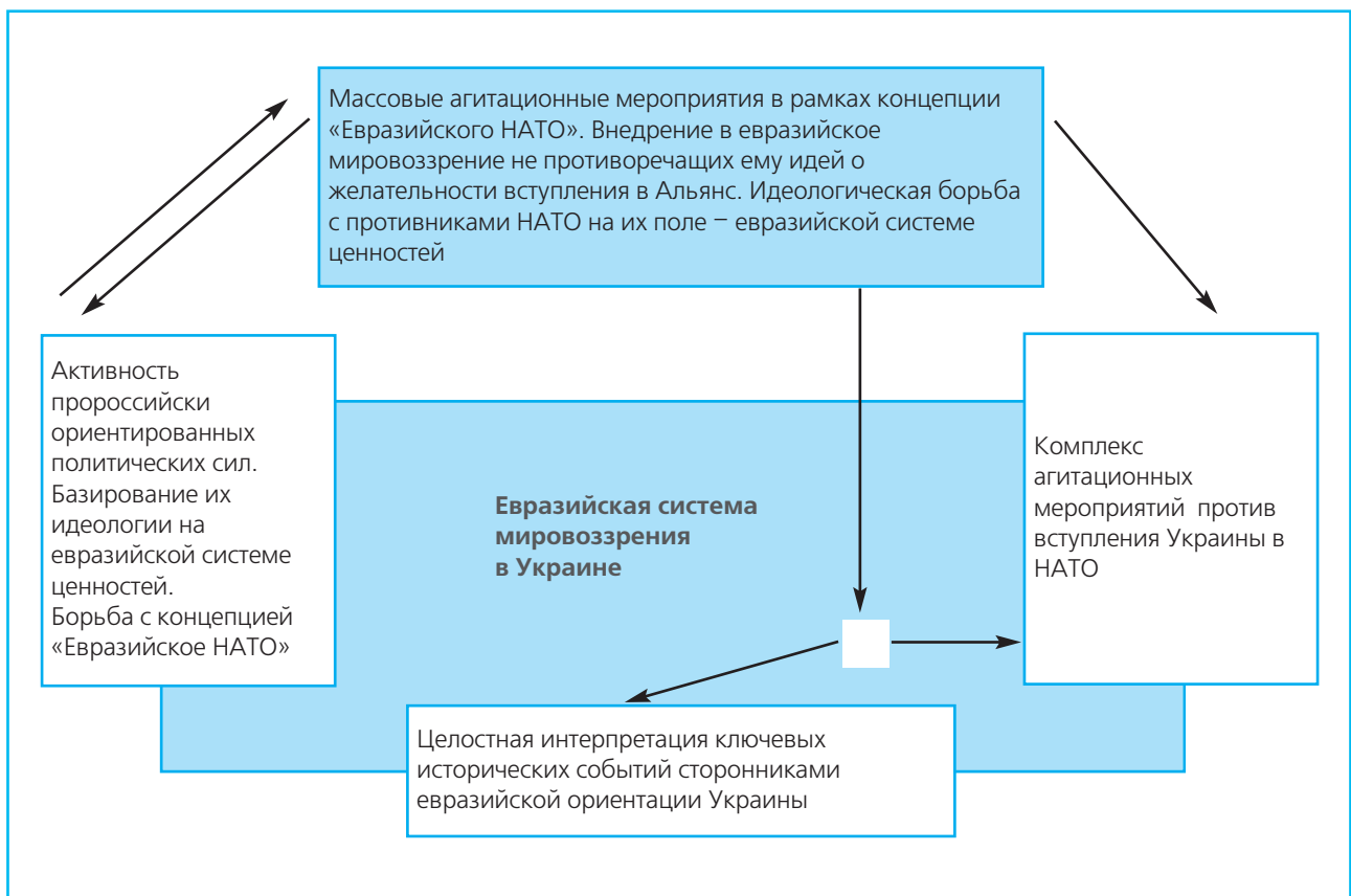
Рис. 3. Место концепции «Евразийское НАТО» в его противостоянии с противниками НАТО

И закончим нашу статью на оптимистической ноте. Все глобальные начинания в истории человечества независимо от того, были ли они таковыми для одного индивида, города, страны или группы стран, в сознании участников проекта проходят практически идентичные этапы психологического восприятия. На первом этапе все выглядит достаточно просто, будущие трудности представляются легко преодолимыми, а цель – близкой. На втором этапе, когда встречаются первые сложности, а за ними – вторые и третьи, постепенно приходит понимание того, что реализация проекта потребует гораздо больше усилий, а конечная цель – очень далека. И тогда нарастает отчаяние и разочарование. В одних случаях проект сворачивается, в других – начинается медленное, тяжелое, но уже реальное и уверенное движение к поставленной цели.